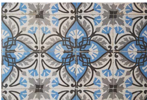
Carreaux de ciment (jpg.5344)