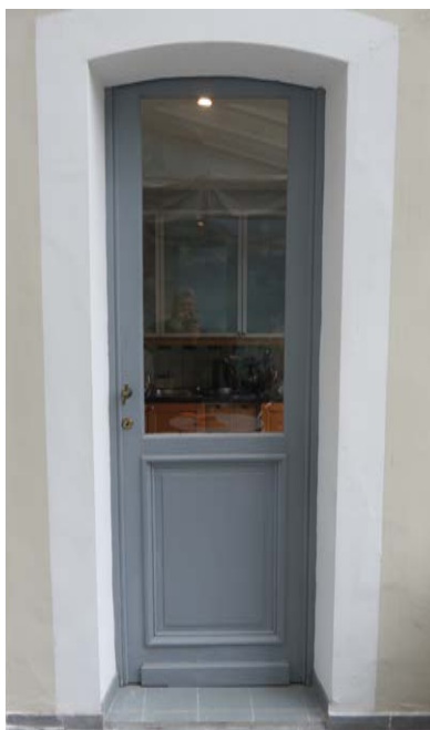
Porte moulurée en bois (jpg.5345)