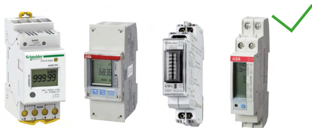
Compteur de certificats verts

Le compteur de certificats verts, à ne pas confondre avec le compteur Sibelga, ressemble à un disjoncteur et se situe généralement dans une petite armoire électrique installée entre l'onduleur et le tableau électrique général.