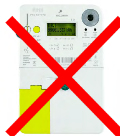
Compteur Sibelga

En avril 2024, le taux d'octroi valable pendant 10 ans est de 2,055CV/MWh pour une installation de moins de 5kWc et de 1,953CV/MWh pour une puissance comprise entre 5 et 36 kWc. Vous avez la possibilité de transmettre votre index de production 4 fois par an à Sibelga.