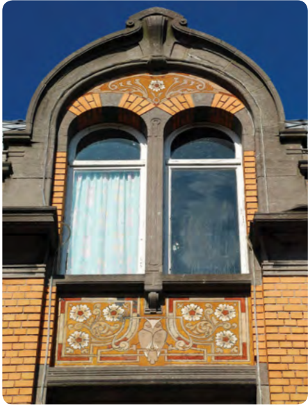
Gemeenschappelijke school van meisjes van Koekelberg, Herkoliersstraat 35-37, 1081 Koekelberg