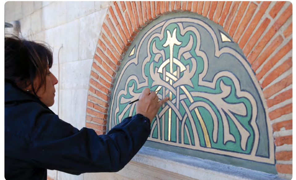
Veronesestraat 9 in 1000 Brussel

De conservator-restaurateur die gespecialiseerd is in muurschilderingen, geeft tips voor het onderhoud van het sgraffito, controleert zijn toestand en grijpt zo nodig in. Alvorens te handelen stelt hij een diagnose, zodat hij de oorzaken van de aantasting kan vaststellen en de geschikte oplossingen kan voorstellen. De acties van de vakman zijn talrijk: hij bestudeert de oorspronkelijke polychromie van het sgraffito, reinigt het, verwijdert de eventuele overschilderingen, verstevigt elke laag en bevestigt ze aan elkaar, maakt de ontbrekende gedeelten dicht en retoucheert ze. Indien het oorspronkelijk uitzicht voldoende gekend is, kan hij de aangetaste kleuren opfrissen en een verdwenen of sterk beschadigde sgraffito reconstrueren.