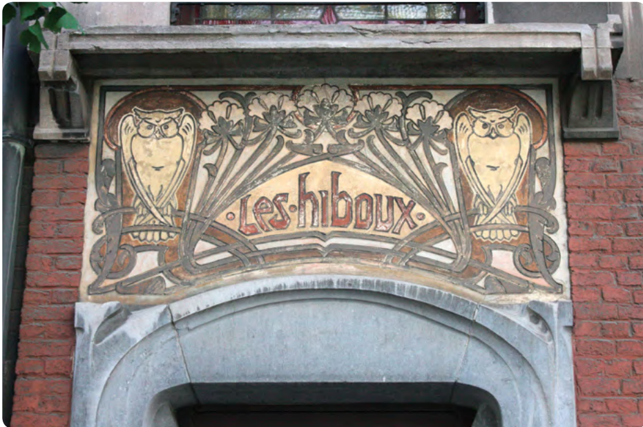
Brugmannlaan 55, 1060 Sint-Gillis