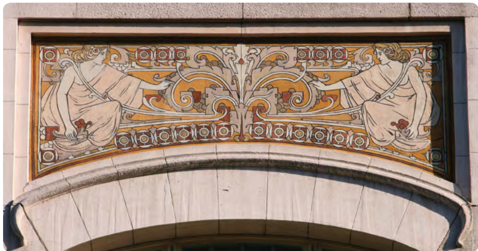
Albert Giraudlaan 9, 1030 Schaarbeek