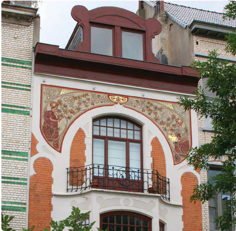
Richard Neyberghlaan 160, 1020 Laken