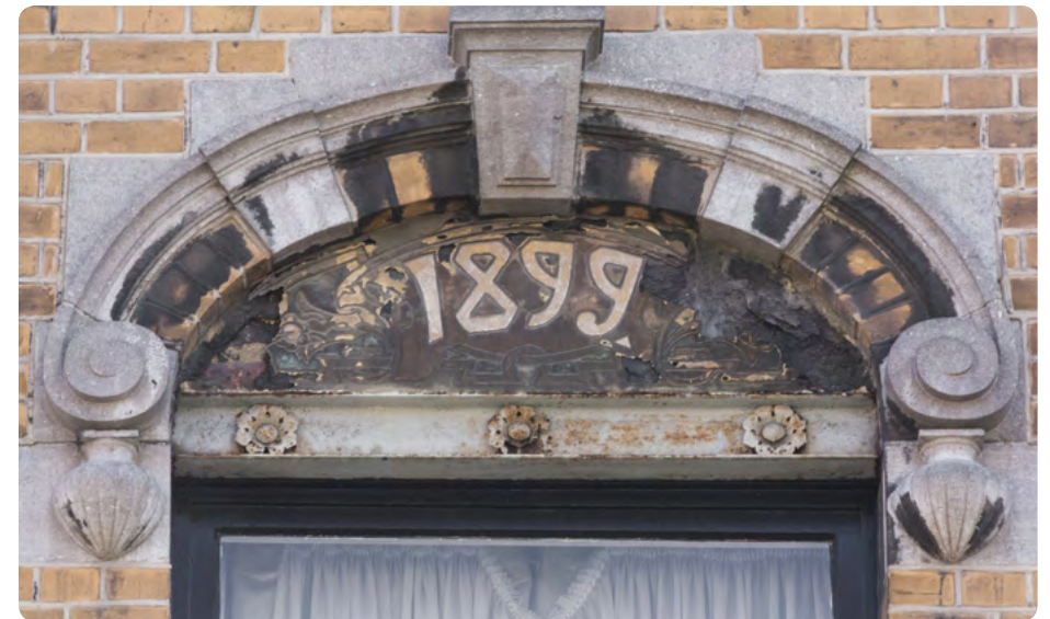
Deze sgraffito heeft vele pathologieën: loskomen van de pleister, zwarte korsten, dof worden van kleuren, enz.

Zodra er witte of donkere vlekken, zwarte korsten of barsten verschijnen, of zodra stukken van de bovenlaag loslaten, is het raadzaam zo snel mogelijk een beroep te doen op een vakman om een diagnose te stellen. Zelf ingrijpen is ten stelligste af te raden omdat de interventietechnieken correct gekozen en uitgevoerd moeten worden, om de pleister niet nog meer te beschadigen.