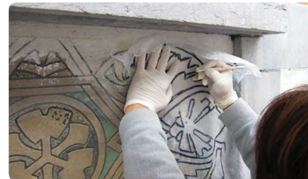
Overbrenging van het motief in de pleister door een ontwerp dat door de calque gedrukt wordt. Veronesestraat 9 in 1000 Brussel

Het aantal lagen en de samenstelling van de mortel, evenals de inkleuringstechniek, kunnen variëren naargelang het atelier.