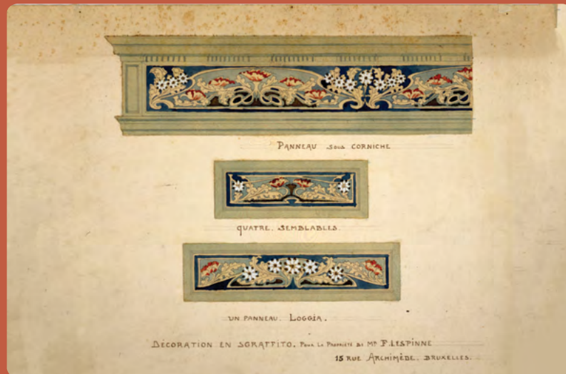
Gabriel Van Dievoet, sgraffiti-ontwerp voor een gevel Archimedesstraat 15, 1000 Brussel Gabriel Van Dievoet verz

In deze brochure vindt u informatie over de technieken van het sgraffito, de conservering en restauratie ervan om dit iconische element van de Brusselse gevels levend te houden.