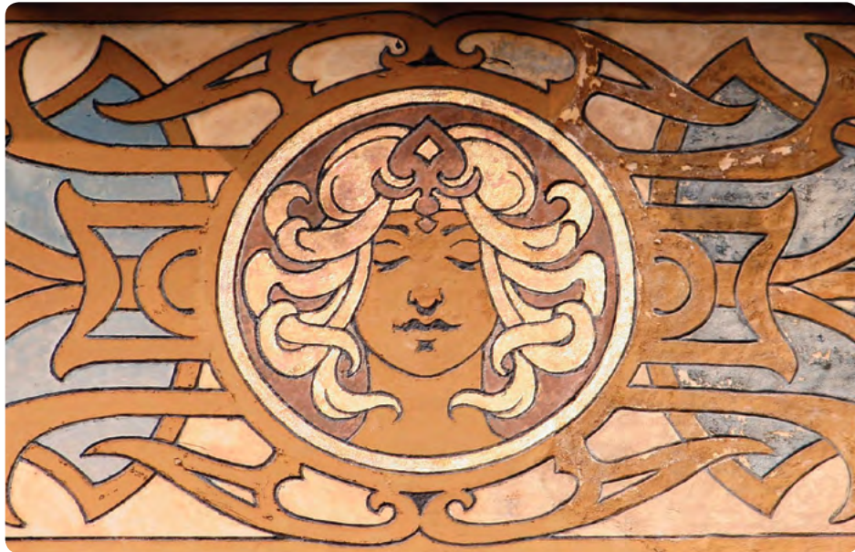
Spanjestraat 40, 1060 Sint-Gillis