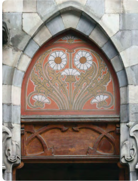
Sint-Bonifaasstraat 17, 1050 Elsene