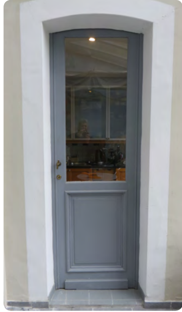
Porte moulurée en bois (jpg.5345)